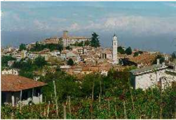
Veduta Panoramica di Rovescala, culla del Bonarda

La nostra azienda si trova a Rovescala paese culla del Bonarda. La coltivazione del vitigno (anche detto Croatina) ha radici antiche che si fanno risalire all'Epoca Romana.